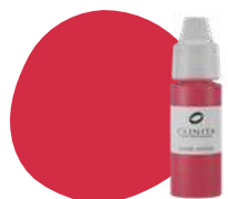
FL26 HIBISCUS PRO

Velvet and purple, slightly cold but ideal for shadow and volumes games, to contrast and balance vibrant and bright colors.