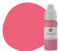
FL27 ORIENTAL LILY PRO

A must have for demanding professionals.