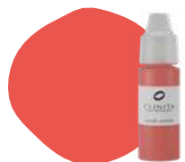
FL22 GLADIOLUS PRO

Mix with Sweet Cherry PRO 272 for lightening and giving volume.