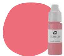
FL24 NINFEA PRO