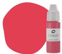
FL21 MALWA PRO

Ideal for lighting coldtending mucous or Fitzpatrick scale 5.