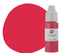
FL23 BEGONIA PRO

A refined and vibrant shade of pink magenta.