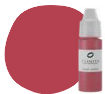
FL25 AZALIA PRO